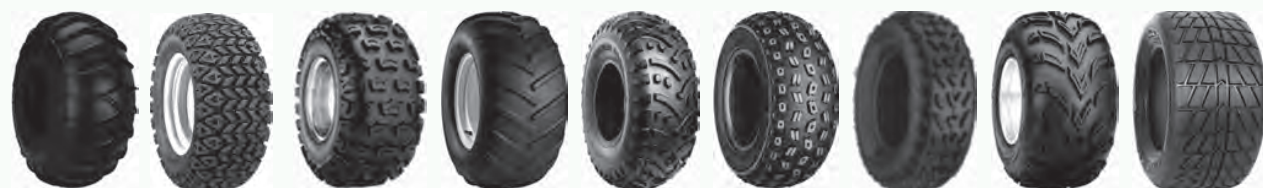
4-Snow All Trail All Trak AT101 Chevron C828 C873N C9251 C9313 Dirt