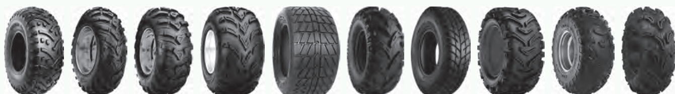
C828 C9311 C9312 C9314 Dirt Mud Wolf Spearz Sur Trak Trail Wolf Zilla