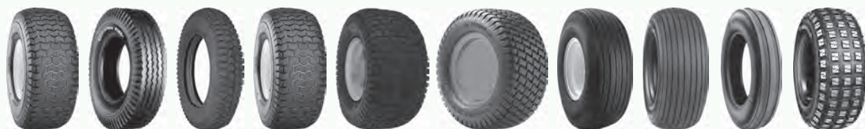
C165 C178 C248 C9266 Chevron Grassmaster Straight Rib T510 T513 T537S