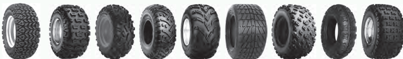
All Trail All Trak AT489 C828 C9314 Dirt Fast Trekker KT111 Razr