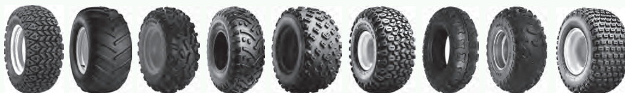
All Trail AT101 Chevron AT489 C828 Fast Trekker HD Field Trax KT111 Trail Wolf Turf Tamer