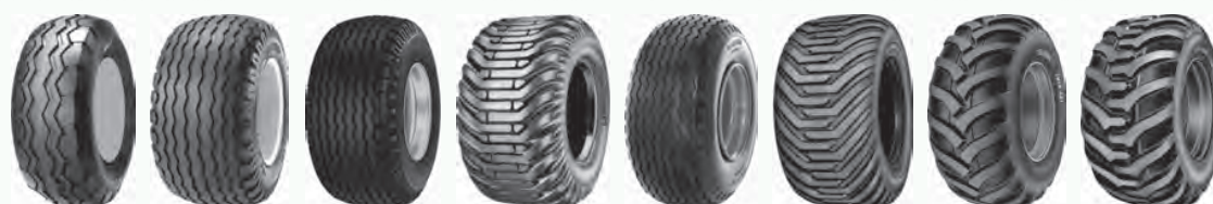
AF302 AW305 AW708 ELS L1 T306 T404 T421 T423