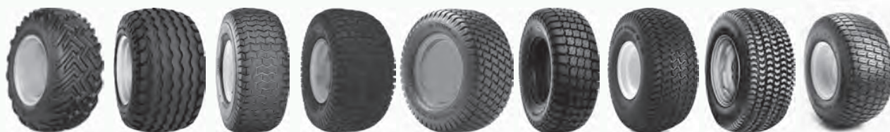
All Service G AW-Farmer C165S Chevron Ultra Grassmaster Mighty Mow Multi Trac PD1 Pro Tech