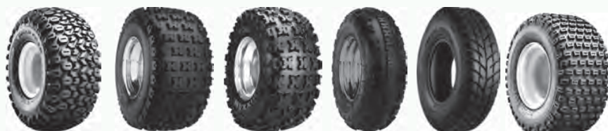
HD Field Trax Razr Razr 2 Razr MX Spearz Turf Tamer