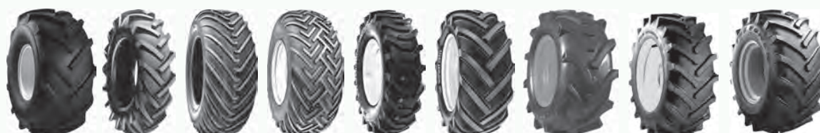
Super Lug T63 T411 T412 T462 IMPL T463 Trac Master Tru Power Tru Power II