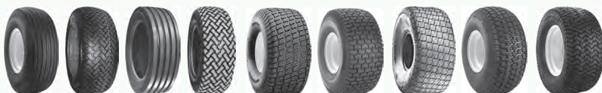
Straight Rib T439 T446 T539 Turf Master Turf Saver Turf Special Turf Trac Ultra Trac