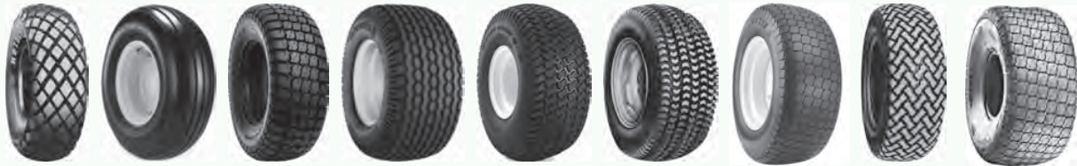
FD Hi Flotation Mighty Mow MultiService Multi Trac PD1 Soft Turf T539 Turf Special