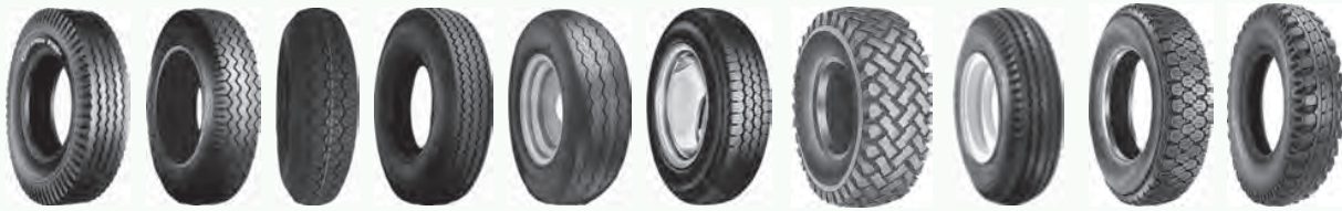
C178 C214 C816 C824 C834 CR966 HF-213 HF-215 HF-229 HF-269