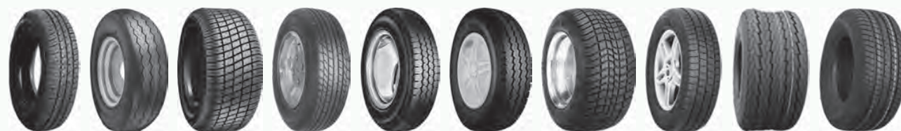
BK403 C834 C8001 Champiro CR966 CR967 K399 Kargomax KT705 KT765