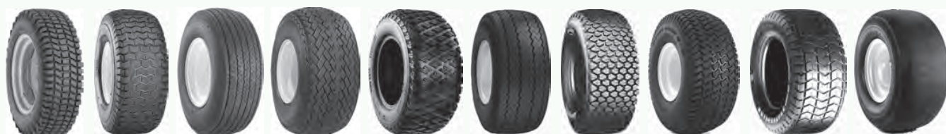
AS B3 C165S Fairway Fairway Pro High Grip Links M40B Multi Trac PD Smooth