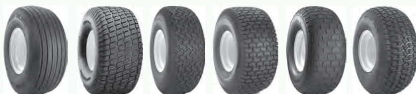
Turf Glide Turf Master Turf Mate Turf Saver Turf Saver 2 Turf Trac