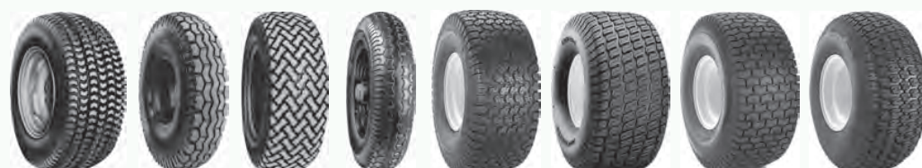
PD1 T523 T539 T991 Turf Chief Turf Master Turf Saver Turf Trac