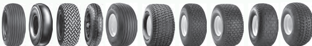
T510 T522 T539 T991 Turf Glide Turf Master Turf Mate Turf Saver Turf Saver 2 Turf Trac