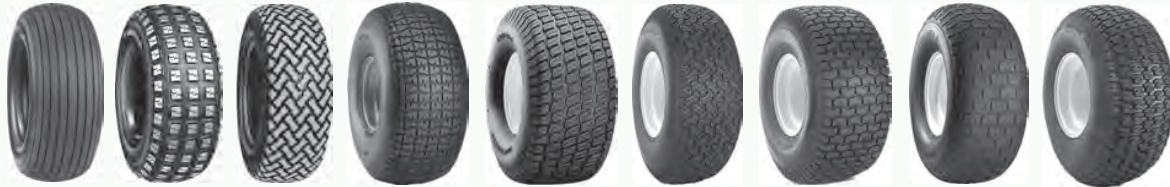
T510 T537 T539 Turf CTR Turf Master Turf Mate Turf Saver Turf Saver 2 Turf Trac