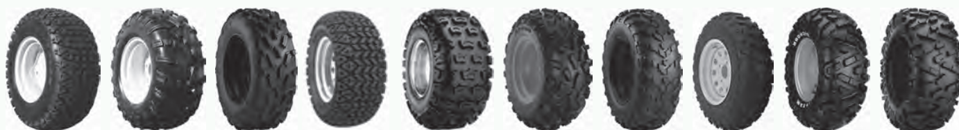
350 Mag 440 Mag ACT All Trail All Trak AT489 Badlands A/R Badlands XTR Big Horn Big Horn 2