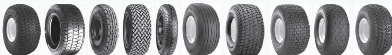
Multi Trac PD T523 T539 T991 Turf Glide Turf Master Turf Saver Turf Saver 2 Turf Trac