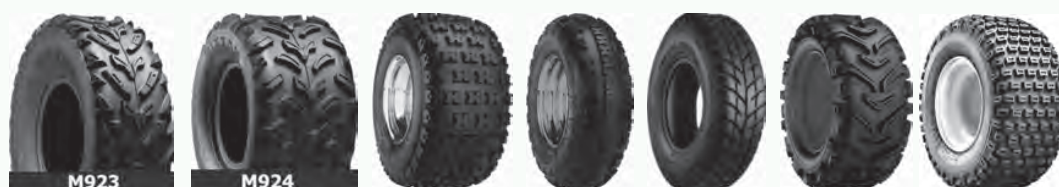
M923 M924 Razr Razr MX Spearz Sur Trak Turf Tamer