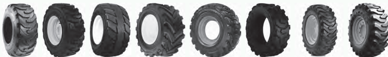
Constellation HD2000_II Lightning Outrigger HF3 Outrigger R4 SK800 Trac Chief Trac Loader