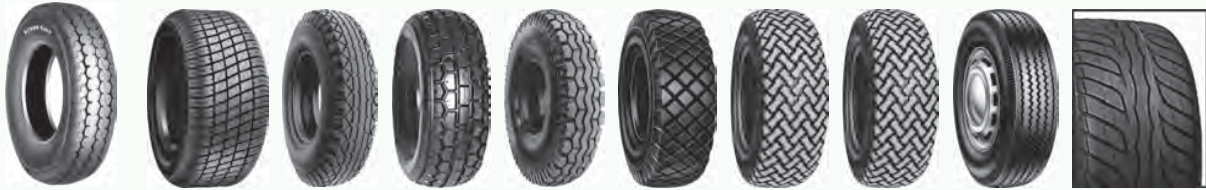
KT-715 M8001 T49 T501 T523 T533 T539 T539 HS T690 T3000