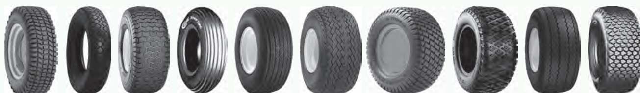
AS B3 C164 C165S C179 Fairway Fairway Pro Grassmaster High Grip Links M40B