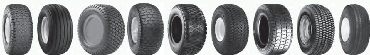
C165S Farm Spec I1 Grassmaster HF-224 High Grip Multi Trac PD PD1 Sawtooth Rib