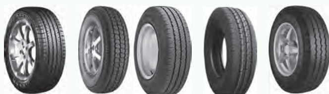
MA-510 Maxmiler RA08 TR-603 UE168