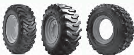
Trac Chief Trac Loader Wearmaster