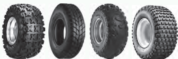
Razr 2 Spearz Trail Wolf Turf Tamer