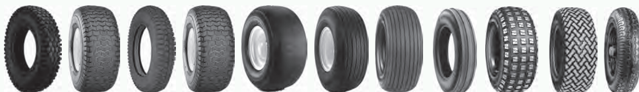
C156 C165 C248 C9266 Smooth Straight Rib T510 T513 T537S T539 T991