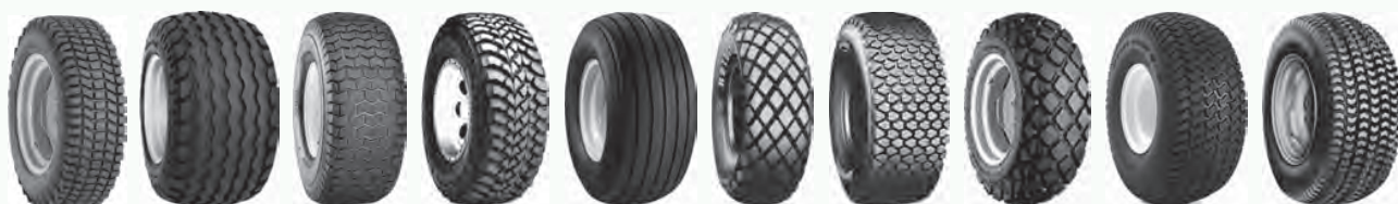
AS B3 AW-Farmer C165 Dynapro MT Farm Spec HF1 FD M40B M159 Multi Trac PD1