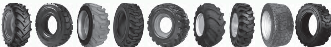
AC70G Beastmaster Electro Hauler Outrigger R4 Remington R1 Remington R4 Sandmaster SK900