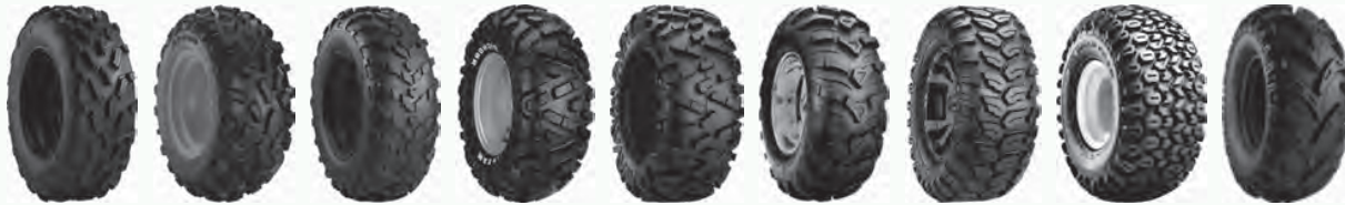
ACT AT489 Badlands A/R Big Horn Big Horn 2 C9312 Ceros HD Field Trax Mud Wolf