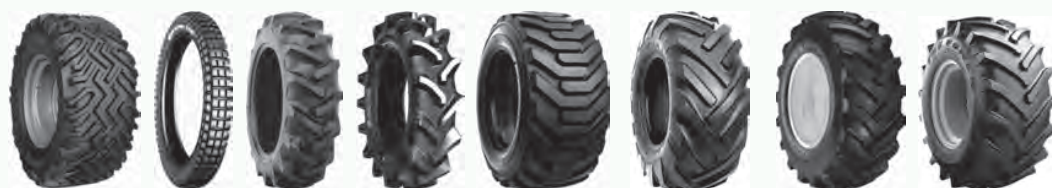
All Ground C186 FL18 FSLM Hippo I3 Trencher Lift Rigger Tru Power II