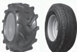
Trac Master Wearmaster Rib