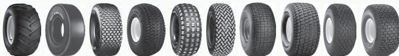
AT101 Chevron C190 M40B Multi Trac T537 T539 Turf CTR Turf Master Turf Mate Turf Saver