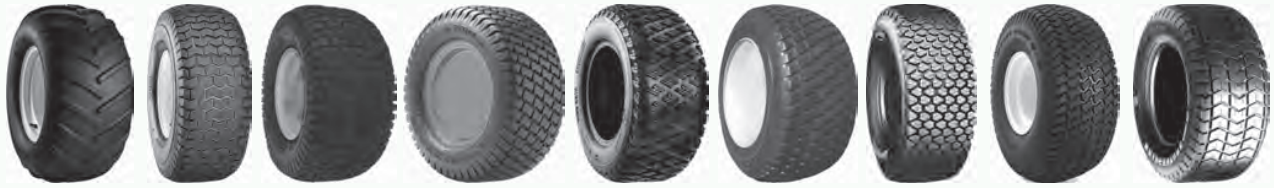
AT101 Chevron C165S Chevron Grassmaster High Grip Lite Foot M40B Multi Trac PD