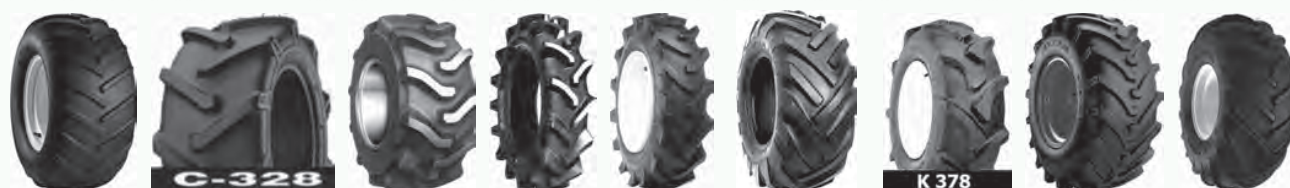
AT101 Chevron C328 FM1 FSLM HF-252 I3 Trencher K378 M7515 Power Trac