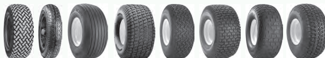
T539 T991 Turf Glide Turf Master Turf Mate Turf Saver Turf Saver 2 Turf Trac