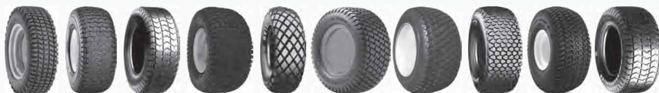
AS B3 C165S C769 Chevron Ultra FD Grassmaster Lite Foot M40B Multi Trac PD