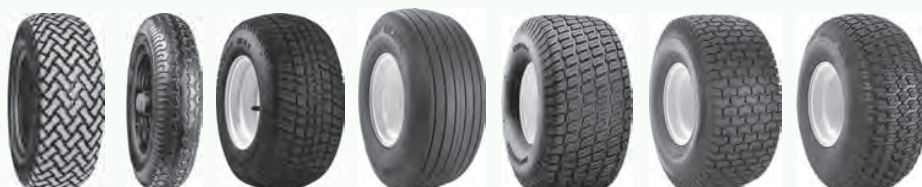
T539 T991 Tour Max Turf Glide Rib Turf Master Turf Saver Turf Trac