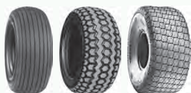
T510 T536 Turf Special