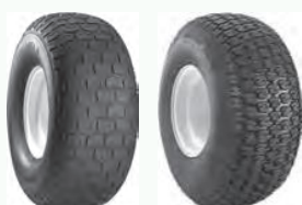
Turf Saver 2 Turf Trac