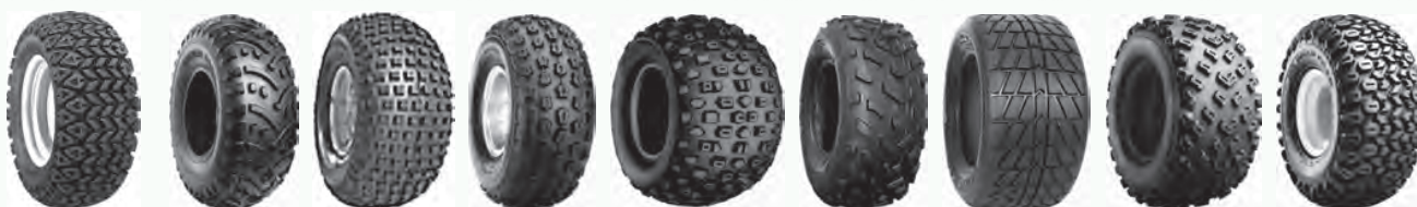
All Trail C828 C829 C864 C874N C9239 Dirt Fast Trekker HD Field Trax