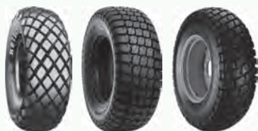
FD Mighty Mow Torc Trac R3