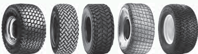
SoftTrac T539 Turf & Field Turf Special Ultra Trac