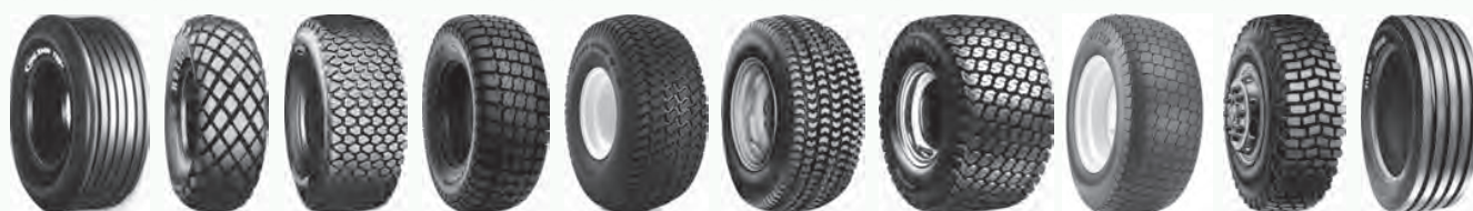
C737 FD M40B Mighty Mow Multi Trac PD1 SoftTrac Soft Turf T94 T448